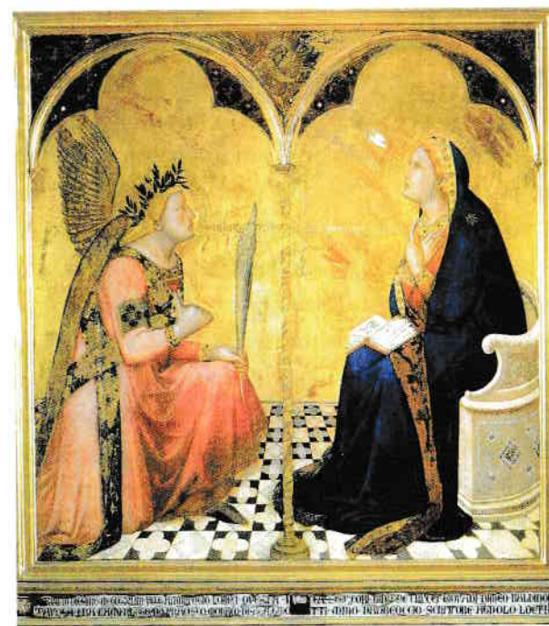
Ambrogio Lorenzetti, L’Annunciazione , tempera e oro su tavola, 1344, 127 x 120 cm, Pinacoteca Nazionale di Siena

L’Annunciazione di Ambrogio Lorenzetti è una delle cinque opere firmate e datate dell’artista, l’ultima in ordine cronologico. La tavola fu dipinta per l’ Ufficio della Gabella del Comune di