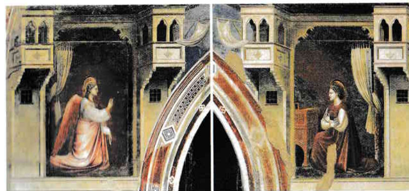
Giotto, L'Annunciazione , 1303 – 1305, affresco, 200 x 185 cm, Padova, Cappella degli Scrovegni

Giotto, discepolo di Cimabue, mirabile scultore e pittore „al pari di Dante nella poesia”, dipinse nella Cappella Scrovegni di Padova scene della vita di Gesù dalla Sua nascita fino al Giudizio Universale (La Legenda aurea), comprendendo anche l' Annunciazione . Quest'affresco è diviso in due scomparti: a sinistra l' Angelo annunciante e a destra la Vergine annunciata . Si trova sull'arco di trionfo presso l'altare, al di sotto della lunetta con Dio avvia la Riconciliazione inviando l'arcangelo Gabriele , che è la prima scena dipinta. La prospettiva delle „due finte architetture sobrie ed eleganti simulanti due stanze con balconcini aggettanti nella parte superiore” tende verso l'esterno e verso il centro della cappella. „I cassettoni, gli archetti trilobati, le cornici, le mensole ornate” sono presentati in dettaglio in colori dolci che preannunciano „gli affreschi della Cappella della